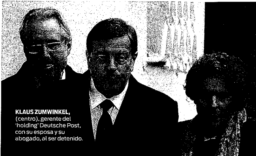
KLAUS ZUMWINKEL , (centro), gerente del 'holding' Deutsche Post, con su esposa y su abogado, al ser detenido.