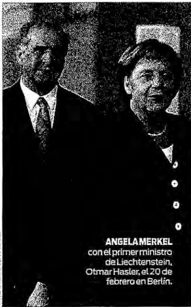
ANGELA MERKEL con el primer ministro de Liechtenstein, Othmar Hasler, el 20 de febrero en Berlín.

91 ACUSADOS de evadir impuestos confesaron su delito en las primeras dos semanas tras la detención del gerente Klaus Zumwinkel. Otros 72 se denunciaron ellos mismos. En 1997, un escándalo similar con 119 procesos concluidos permitió a Hacienda recuperar 95 millones de euros.